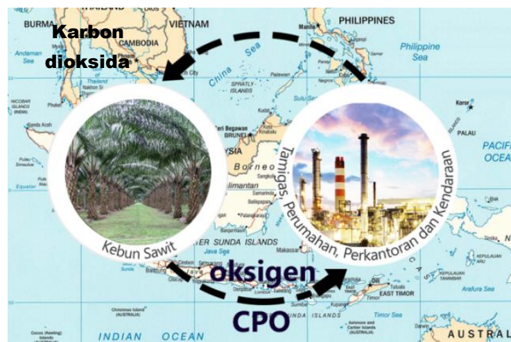
Gambar 1. Perkebunan Kelapa Sawit Sebagai Bagian “Paru-Paru” Ekosistem

Lewat metabolisme tanaman tersebut, karbon dioksida dipecah menjadi karbon dan oksigen. Karbon kemudian diproses dan dirubah menjadi tubuh tanaman (akar, batang, daun) dan produksi tanaman untuk kebutuhan manusia. Sedangkan oksigen dikeluarkan ke atmosfer/udara bumi untuk kehidupan manusia, yang kita hirup saat menarik nafas. Karena tumbuhan memiliki kemampuan menyerap karbon dioksida dari atmosfer bumi dan menghasilkan oksigen (memasok oksigen) ke atmosfer bumi, tumbuhan hijau termasuk kelapa sawit disebut juga sebagai “paru-parunya” ekosistem (Gambar 1).